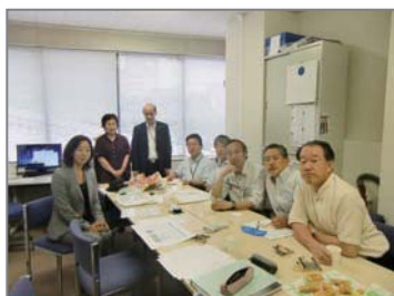
▲ 川崎支部事務所内にて、理事会開催の様子