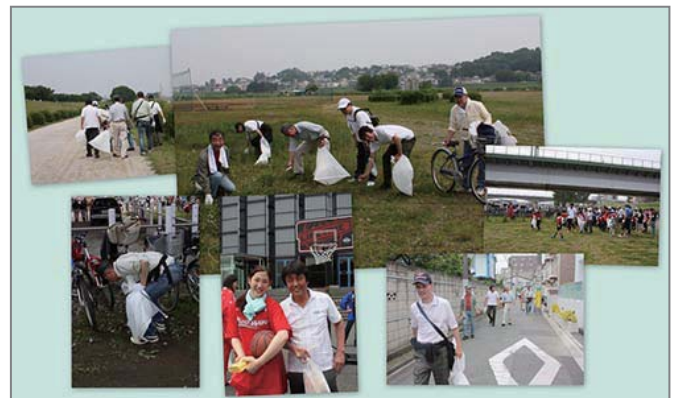
▲多摩川での美化活動風景、他の団体も大勢参加していました。