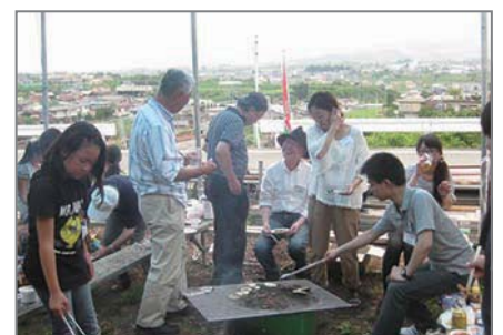
▲サクランボ狩りの後は、お楽しみバーベキュー!