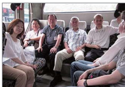
▲移動中のバスの中で記念撮影