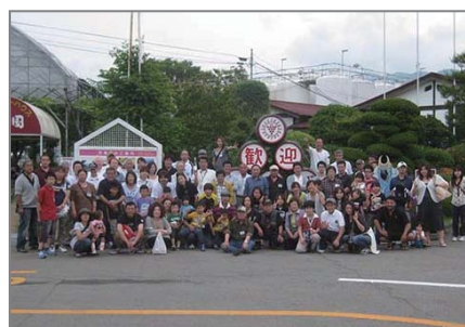
▲マンズワイン工場記念撮影