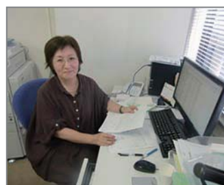
▲事務局へのお立ち寄りお待ちしております。

この度、(社) 神奈川県建築士事務所協会 川崎支部の事務局事務員として働く事になりました。皆様のお役に立てるよう頑張っていきます。事務局へお立ち寄りの際は、お気軽にお声をお掛け下さい。