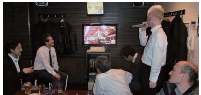
📷 二次会はカラオケです。点数合戦は負けず嫌いの性格の人が多いためか、終わりのない戦いになってしまいます。今年も、皆様 お疲れ様でした。