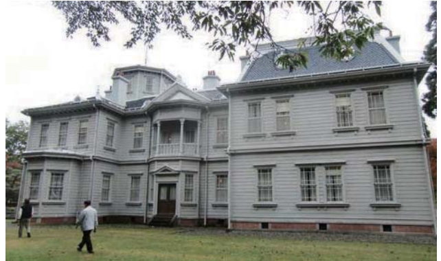
📷 天鏡閣(国指定重要文化財)を見学