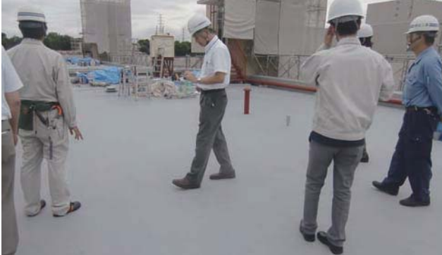
☉ 屋上防水改修工事の見学