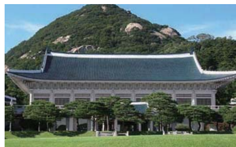
青瓦台(大統領官邸)