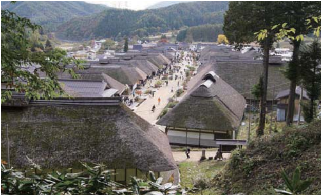
📷 大内宿を見学