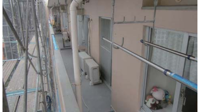
☉ バルコニー改修工事を足場から実施状況を見学