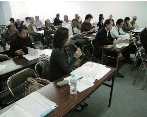
📷 設計者による建物、設計概要説明は、多摩区役所にて行われました。