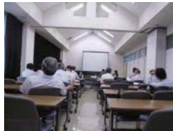
📷 ビデオによる講習の様子

本会 設計監理指導委員会では「机の隅に」と題した建築実務ガイドブックを作成。 この本は日常の業務を行う上での基本的かつ重要な知識や情報をまとめた内容になっており、この本を使用した講習会を開催しました。最後に設計監理指導委員弁護士および地元弁護士様にご参加いただき、ディスカッションを行いました。