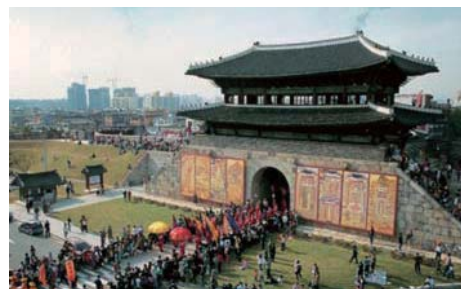
見学予定 水原華城(世界遺産)