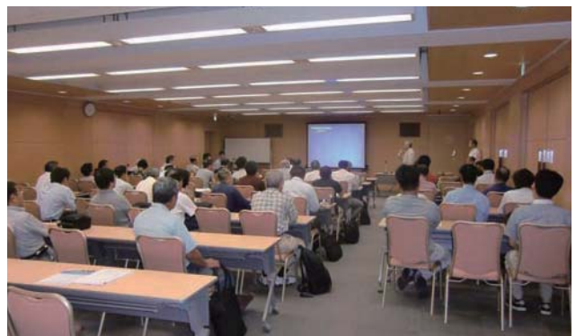
☉ 参加者 支部正会員39名 非会員15名 建築士会21名 計75名