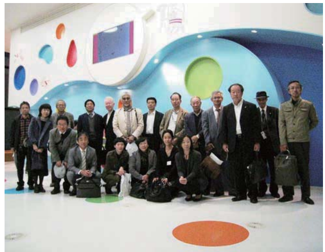
📷 藤子・F・不二雄ミュージアムにて記念撮影