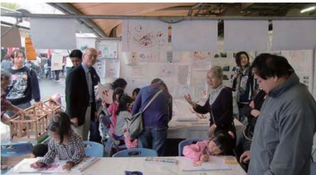
📷 子どもお絵かきコーナーは、子ども連れの方が、毎年目当てで来てくれる当支部ブースの恒例イベントとなっています。今年もかわいいお子さんで大盛況でした。

川崎支部は、毎年、かわさき市民祭りに、神事協川崎支部のPRと防災・耐震の重要性のアピールするために出店しています。この市民祭は、50万人も集まる市内の大イベントですが、今年は、耐震に関する関心の高さなのか、いつもよりも多くの方の来場がありました。場 所：富士見公園一带