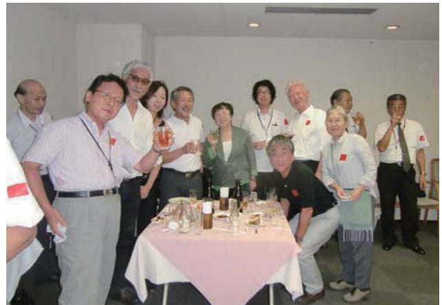
📷 フェスティバルの懇親会