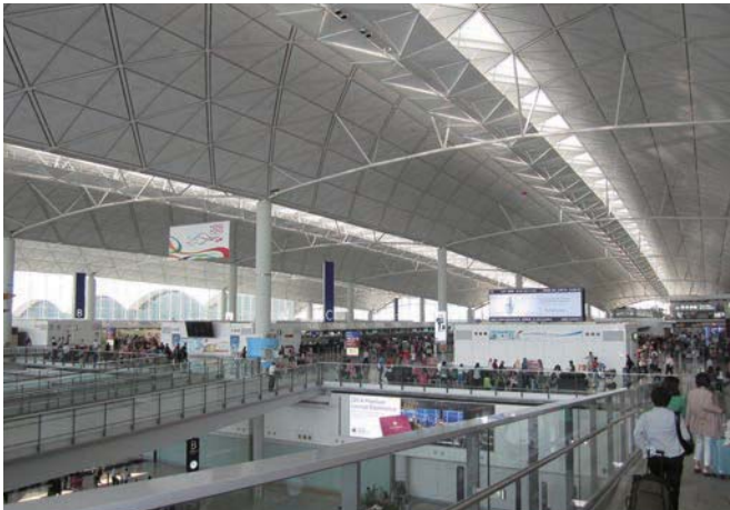
「香港国際空港」1998年ノーマン・フォスター設計 最初に我々を迎えてくれた建物で、そのスケールの大きさに羽田空港の拡張が期待されます。

1997年のイギリスから中国への返還をへて、世界の注目を集めた香港建築の現在を危惧しておりましたが、更に高い自由度を得て、上海・シンガポールという国際都市との競争力を維持しているように見えました。更に対岸の急膨張都市・深圳を經由して中国本土との新幹線工事が進められており、今回視察した超・超高層スカイ100の足元で新駅が建設中です。中国本土からの人の流れは、これも建設中の道路でマカオに直結される事となり、巨大なネットワークが形成されつつあります。世界有数のカジノリゾート・マカオと金融都市・香港、生産都市・深圳にあふれる人・物・金の動きに比べ、日本の静かさが危惧される視察会でした。