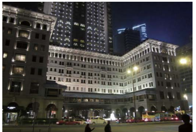
イギリス統治時代を偲ばせる希少建物「ペニンシュラホテル」