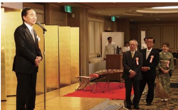
▲ 黒岩県知事のご祝辞

1/17 平成 26 年三会合同新春賀詞交歓会 場所：ホテル・キャメロット・ジャパン（横浜）