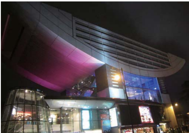
「ザ・ピーク」1993年テリー・ファレル設計 ビクトリアピーク山頂の観光施設ですが、霧の中に夜景は望めず。