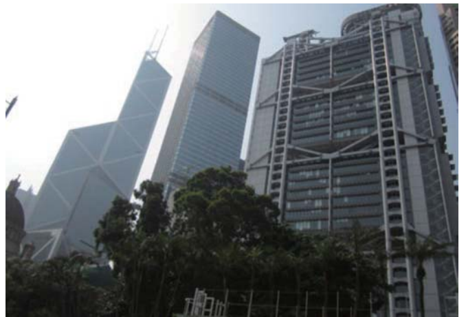
左：中国銀行 1990年建設 設計イオ・ミン・ベイ 右：香港上海銀行 1985年建設 設計ノーマン・フォスター