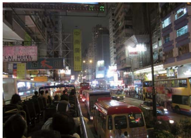
オープントップバスから見た香港