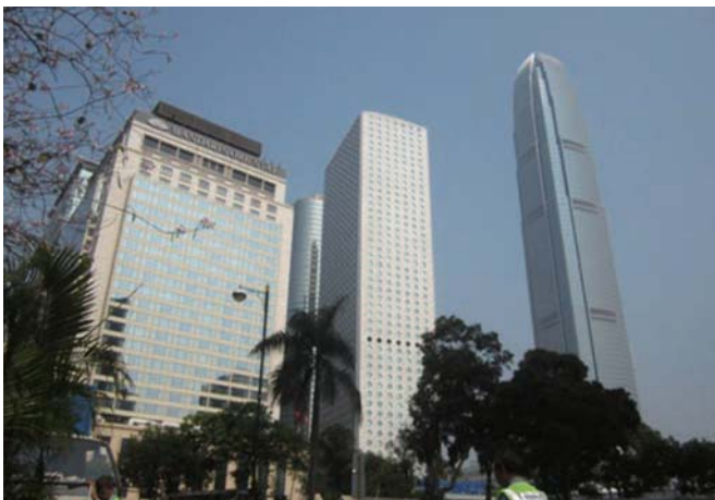
左：香港スカイ100 2010年建設