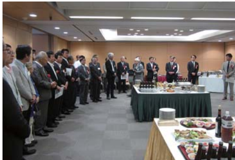
▲ 総会後に開催された交流会の様子

5月27日（火）ユニオンビルにて支部総会が行われました。 祝辞挨拶では、川崎市長よりあいさつをいただきました。 総会後には交流会が行われました。