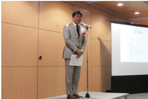
▲ 川崎市長 祝辞挨拶