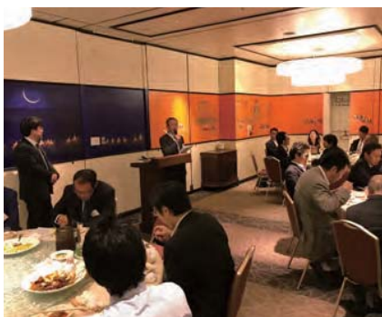
▲ 柏木支部長による事務所協会のPR