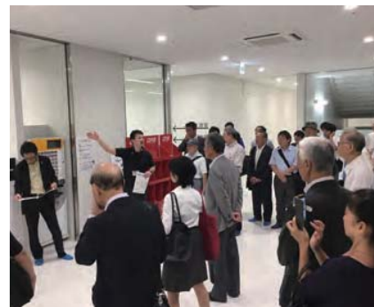
▲ スポーツジムも出来ました。