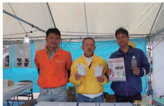
▲ 三団体によるスタンプラリーを実施