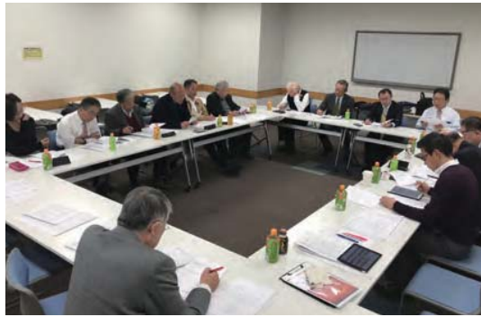
▲ 合同役員会の様子