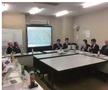
▲ まち局職員による小杉の街の移り変わりを説明頂きました。