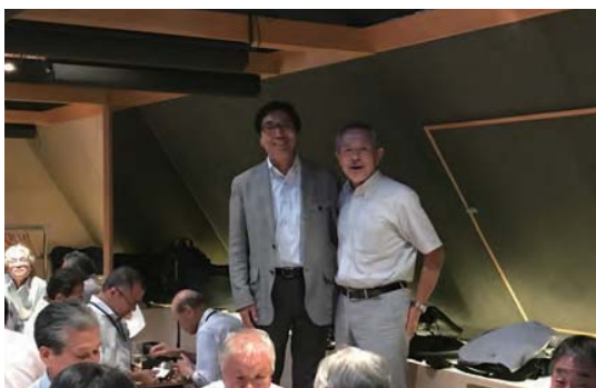
▲ 白井会長と柏木支部長