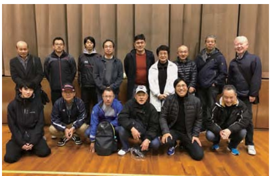
▲ 川崎・横浜支部の混合チーム