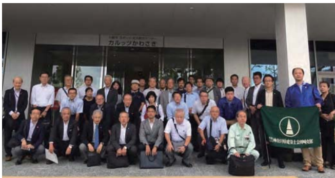
▲ 建築士会川崎支部、川崎市建築家の会と共同開催