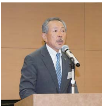
▲ 柏木支部長の挨拶