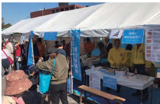
▲ 出店ブースの様子