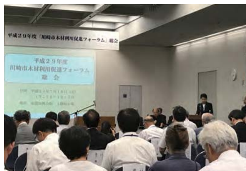
▲ 支部長が参加しました。