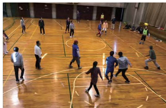
▲ ドッジボール大会