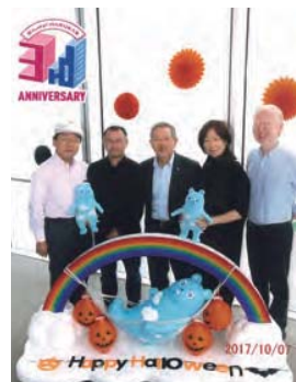
▲ あべのハルカスにて