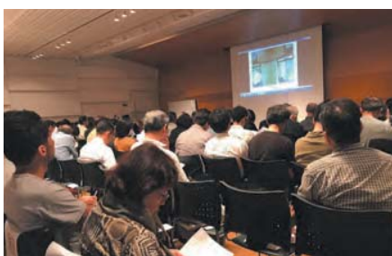
▲ ミューザ川崎市民交流室にて開催されました。参加人数 92 名(登録人数 146 名)