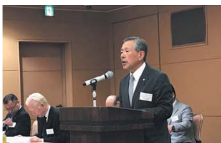
▲ 柏木支部長あいさつ