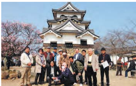
▲ 彦根城にて記念撮影