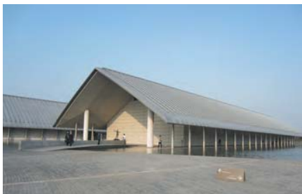
▲ 佐川美術館(設計・施工:竹中工務店)