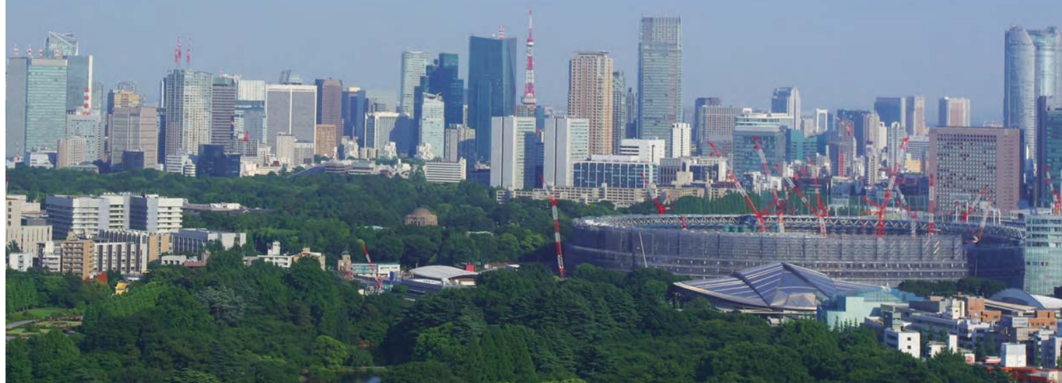
写真は、国立競技場です。