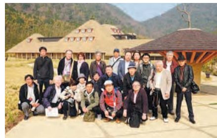
▲ ラ・コリーナ(設計:藤森照信)