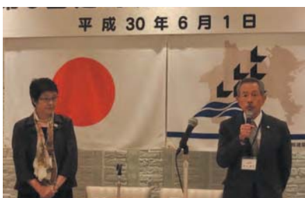
▲ 副議長を務められた柏木支部長のあいさつ