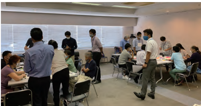
▲8月29日 施設計画検討のための第1回ワークショップを開催

はぐるまの会「多摩区拠点施設建設設計画」における、父兄会の意見を吸い上げるためのワークショップを開催しました。コロナ禍の中のため、参加人数を制限し、オンライン参加も可能な環境を整えました。