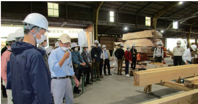
▲製材プレカット加工移設 見学

川崎市木材利用促進フォーラムの取組で11月19日・20日に和歌山県視察「紀州材現地見学会」に参加しました。日本屈指の木材生産地である木の国・わかやまで、良質な紀州材が育まれる過程を、現地を巡って体感してきました。現地事業者との意見交換もあり、盛りだくさんの有意義な見学会でした。(ノマド 永島)