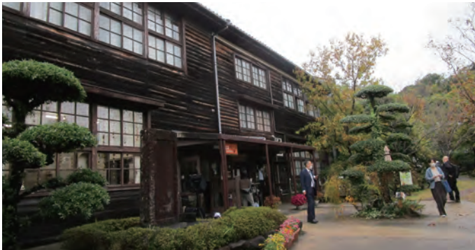
▲秋津野ガルデン 元小学校をリノベーションした体験グリーンツーリズム施設を見学