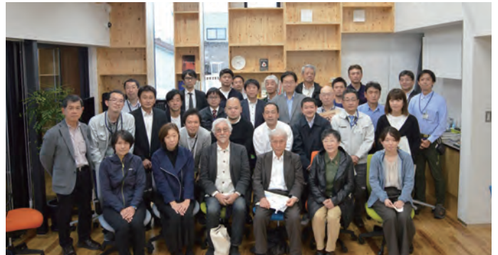
▲地元事業者との意見交換会 会場にて記念写真