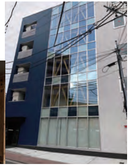
▲川崎支部で監修を行っていました司法書士会館が竣工しました。