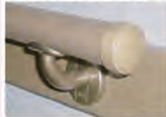
<望ましい手すりの例>