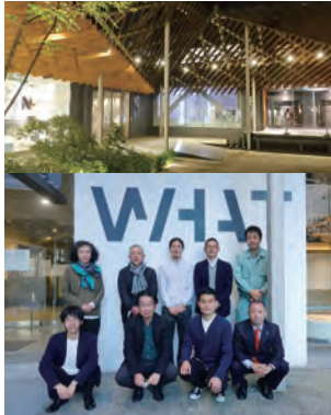
▲上 WHAT MUSEUMと模型保管庫の施設外観 下 エントランス前での集合写真

東京豊洲にある寺田倉庫のWHAT MUSEUMの展覧会と模型保管庫の見学会を行いました。 模型保管庫には国内の著名建築家の様々な模型が展示されており、目を見張る圧巻の光景でした。 今回特別に学芸員のガイドツアーを組んで頂き、展覧会の作品解説から制作秘話まで拝聴できた有意義な見学会となりました。