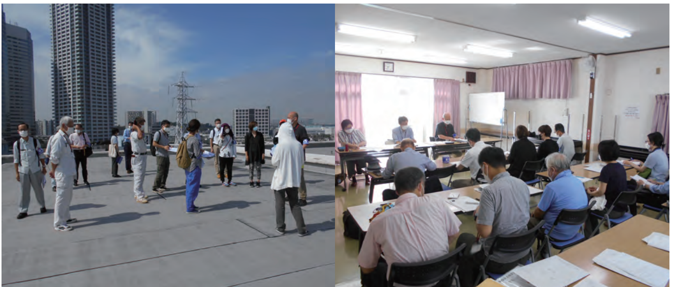
●パイロット調査(模擬調査)の様子