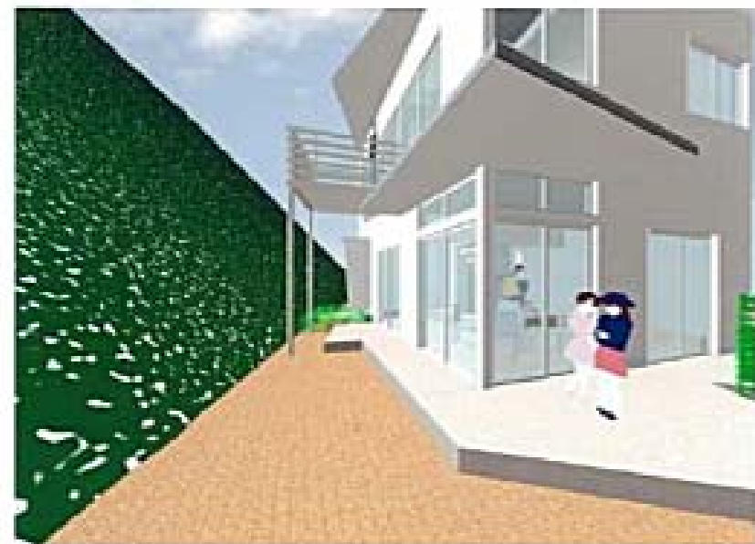
●土間サロンと玄関は山に開放 奥は山に開放された浴室の庇