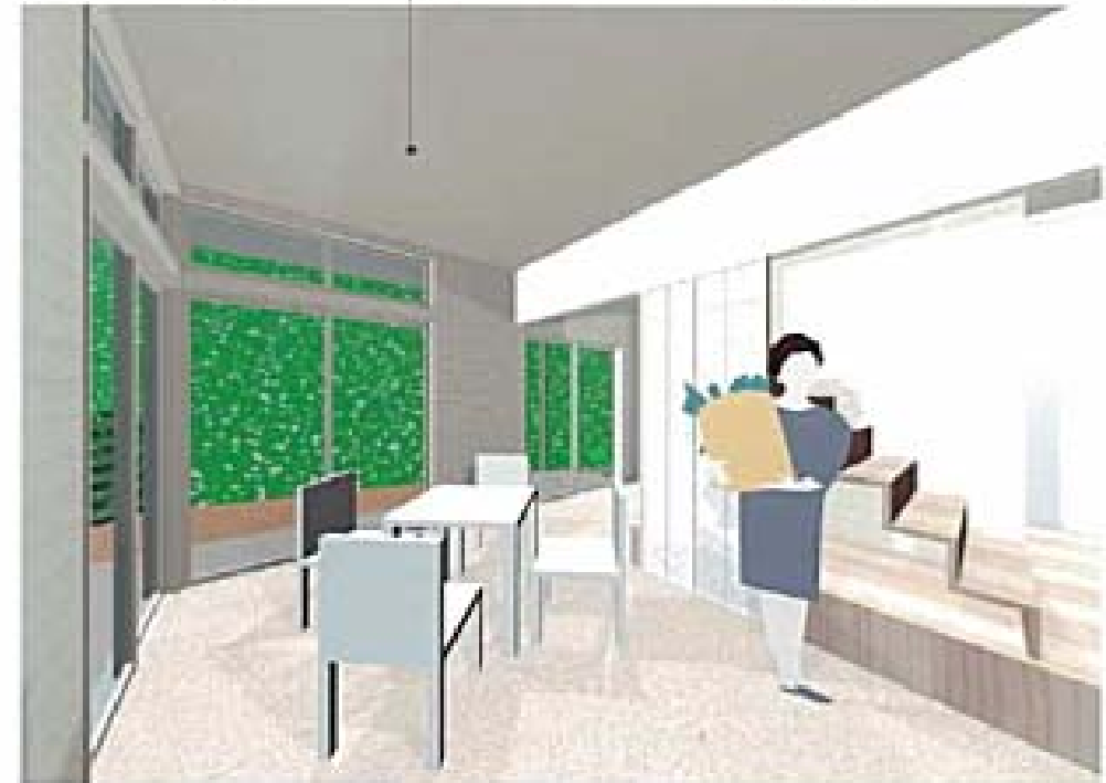
●1階サロンより山を見る 床はカラクリート