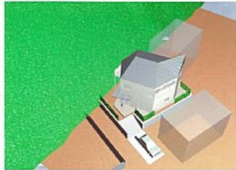
●空より見る 金属屋根