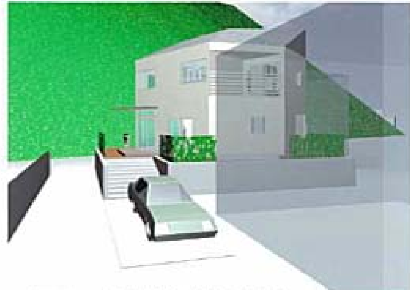
●アプローチより見る 外壁：サイディング 2階7-7m² 55m²は北側