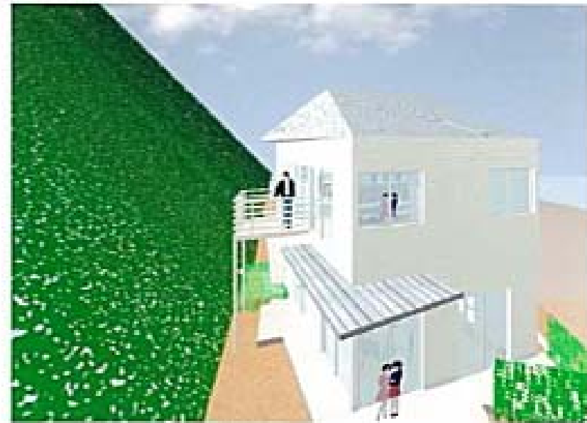
●山に向かって開ける窓とバルコニー